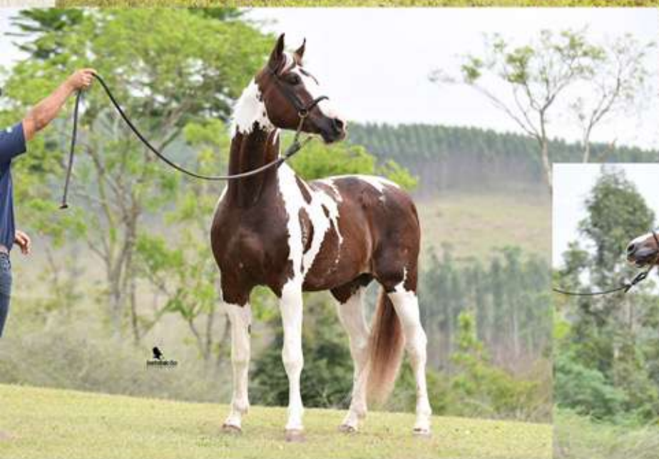
seu pai, Ferragamo da Piratininga