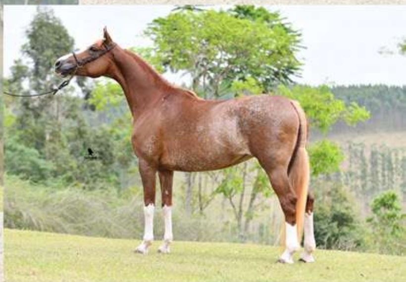
sua mãe, Coxilha CASS