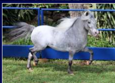
Pai Avaré Coronel