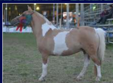
Irmã materna Caia de La Colmena

Um show! Égua extra, irmã materna da Caia de La Colmena e filha do Campeão Nacional Ilo de Bicas. Portanto é neta do Grande Campeão Expointer 2024 e pai de campeões, Vision Cash da Meninada. Úrsula possui muita estrutura, morfologia equilibrada e pelagem exótica. Sem dúvida a opção certa para compradores criteriosos. Segue com prenhez confirmada do Veredito de La Colmena