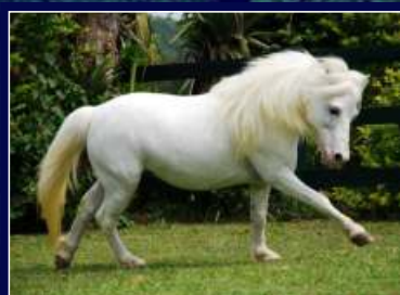
Avô Materno Cadillac LM do Recreio

Literalmente exótica! Pelagem linda, muita raça e fertilidade! Égua de muita raça, filha de GARF Tango em GARF Halali, um mix de genética consistente. Leva ao pé uma potra filha do Campeão Nacional EPI Níquel e segue com barriga para livre acasalamento. Lote com excelente custo-benefício.