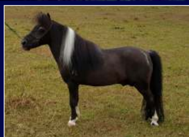
Pai Galã do Marcon