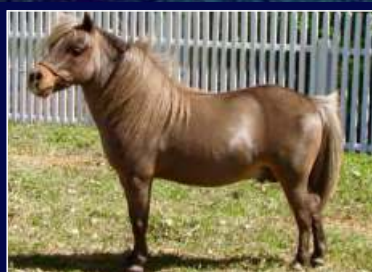
Avô Materno Hi-Tech do Japão

Pantera é uma matriz estruturada, excelente mãe e com excelentes proporções. Leva em suas veias Omelete de Bebedouro e Hi-Tech do Japão, sangue aberto e de excelentes resultados. Segue vazia com total garantia de fertilidade.