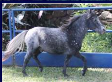
Avô Paterno Avaré Homeland

Lote para os amantes de Pampa de Preto! Potrinha linda, refinada e da pelagem mais procurada do mercado. Genética Avaré e Jequitibá na linha paterna.