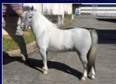
Pai Ilo de Bicas