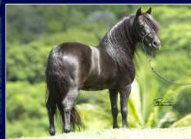
Avô Paterno Veto da Meninada

Potra castanha com muita genética, expressão racial e qualidade morfológica. Na sua linha alta vai ao Res. Campeão Nacional Prado's Zorro, um filho do Grande Campeão Nacional Veto da Meninada. Na linha baixa temos a Tieta Elite Horse, que vai a Black White AN de Santa Tereza. Chama muito atenção pelo seu tamanho diminuto e esbanja delicadeza nas suas proporções. Potra de pista e certeza de futuro promissor!