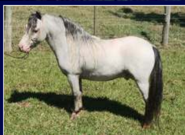
Pai Hunter da Água Azul