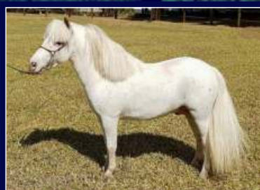
Avô Paterno New Tech da Água Azul

Potro muito estruturado com uma frente exuberante e ainda sangue azul. Seu pai Hunter da Água Azul, é neto de Hi-tech do Japão e nada mais nada menos que a Multi Campeã Hortênsia de Bicas. Em sua linha baixa filho de uma de nossas matriarcas preferidas, Dondoca da Água Azul, que também é mãe da Lady da Água Azul que hoje integra o seletor time Bic.