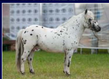
Pai Garf Tango