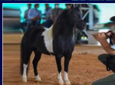
Cobertura Queóps do Triângulo

Pretinha diferente! Filha do Livro de Mérito O.M Intruso na Karma Vento Ventania, que vai a Avaré Bandit, Vision Free de Avaré e Question de Avaré, Segue coberta do Res. Campeão Nacional Queóps do Triângulo.