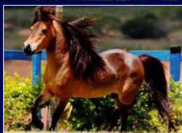
Pai O.M Intruso