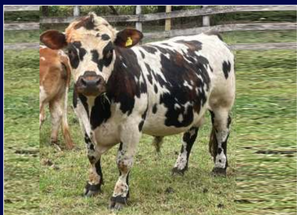
Pai da Sandy Richarlison do Bom Fim

FÊMEA | 78 | 15/02/2024 - MACHO | 75CM | 26/09/2023