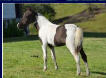
Filha Xalana da Ribalta

Para tudo leilão! Sonho de consumo de muitos criadores! Nobreza é uma das principais fêmeas já nascidas na tropa Ribalta, com muita raça, estrutura, expressão racial e ainda segue com prenhez confirmada do Pampa de Preto Homozigoto Futuro FOM. Simplesmente uma eguassa, Pampa e maravilhosa. Atenção para este lote!