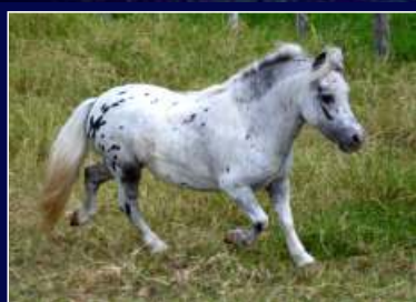
Pai Luxor D'Luca