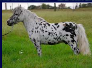
Avô Materno Orgulho do Marcon

Uma pintura !!! Como não se bastasse uma maravilhosa pelagem, Carine é dona de proporções que chamam muita a atenção. Filha de Galã do Marcon, descendente do imortal Avaré Mosquito em Isabelita da Água Azul, uma filha do comprovado Orgulho do Marcon. Sangue tradicional em uma morfologia extremamente atualizada, receita para quem quer fazer sucesso nas pistas de todo o Brasil.