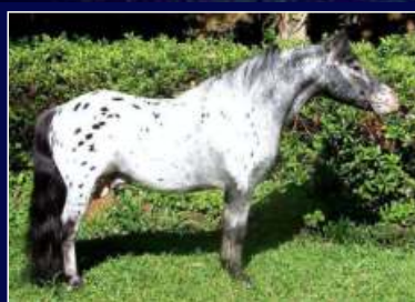
Avô Paterno Question de Avaré