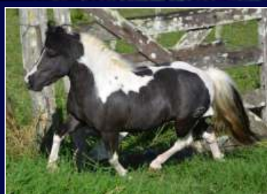
Prenhez Futuro FOM