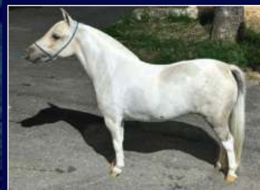
Irmã paterna Lua da Jóia Rara

Potro preto pampa com uma genética invejável, na linha alta ele vai ao grande Bad Boy da Jóia Rara que leva ao livro de mérito Talismã da Meninada e na linha baixa sua mãe Muriel Bic é uma filha do Grande Campeão Nacional Iago de Bicas. Potro tirado da cabeceira do Haras Jóia Rara para abrilhantar qualquer plantel. Potro de pista, e sem dúvida alguma um futuro reprodutor excelente!