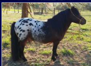
Pai Avaré Novelo