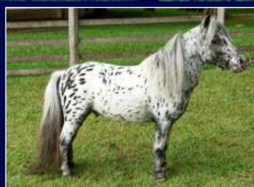
Avô Paterno Zoomp de Avaré

Potra castanha de linhas femininas, filha do Avaré Novelo, um filho do Zoomp de Avaré, que vai a Sun Ligth de Avaré.