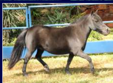
Mãe Vernissage de Avaré

Simplemente maravilhosa! Uma égua com todas as qualidades morfológicas, currículo e um pedigree de sucesso. Seu pai o Tri Grande Campeão Nacional e Campeão dos Campeões MH, Avaré Coronel, este um filho do Xeque-Mate de Avaré, e neto do pequeno Dun Dreamin, reprodutor importado dos USA. Sua mãe Avaré Vernissage que também conquistou nas pistas os títulos de Tri Grande Campeã Nacional e Campeã das Campeãs MH, filha do legendário Question de Avaré. Com todos os títulos máximos na sua ascendência, Felicity não negou a sua origem e tem um currículo com mais de 45 premiações, incluído o Reservado Campeonato Nacional Égua 2019 em Conselheiro Lafaiete. Segue com ventre para livre acasalamento e total garantia de fertilidade.