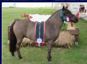
Obra Prima LP de La Colmena

Literalmente uma obra prima!!! Égua destaque do time La Colmena, de produção consistente, muita raça e estrutura, aquisição certa para os mais exigentes criadores. É sem dúvida uma das melhores fêmeas já criadas na Cabanha La Colmena. Segue com prenhez confirmada do Avaré Elf Good. Foi Reservada Grande Campeã, Tri Campeã e Tetra Reservada Campeã na Expointer.