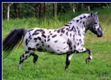
Pai Prado's Zorro