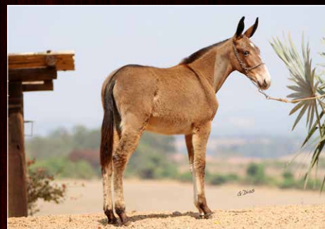
CACIQUE DA TROPA BOCAINA