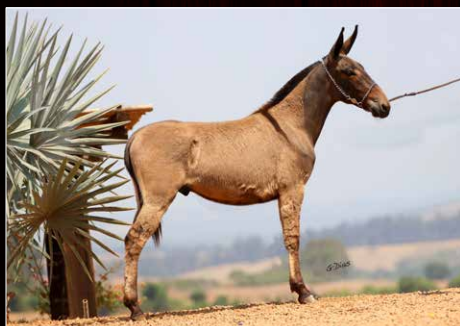
NOTURNO DA TROPA BOCAINA