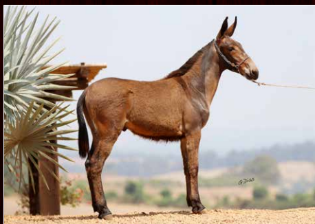
IMPÉRIO DA TROPA BOCAINA