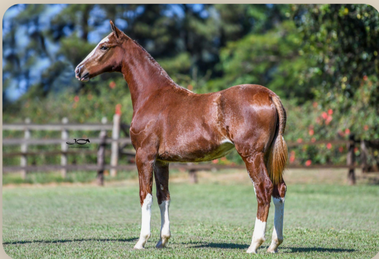
Siena da Araxá Filha