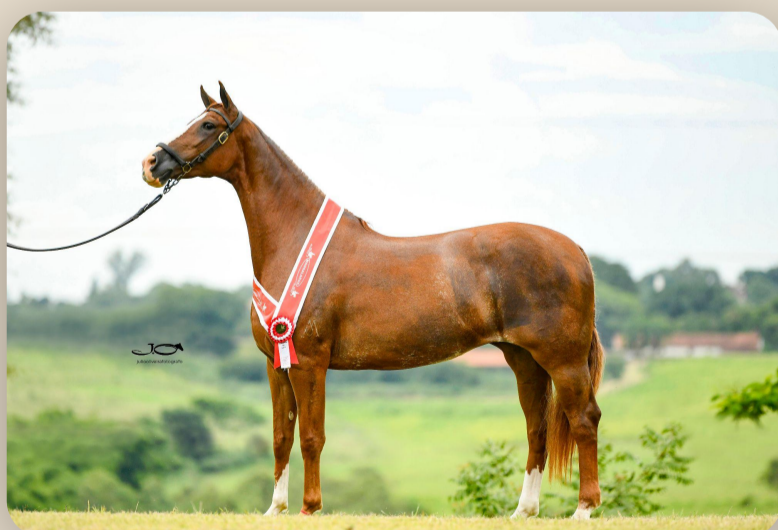
Eleita da Araxá