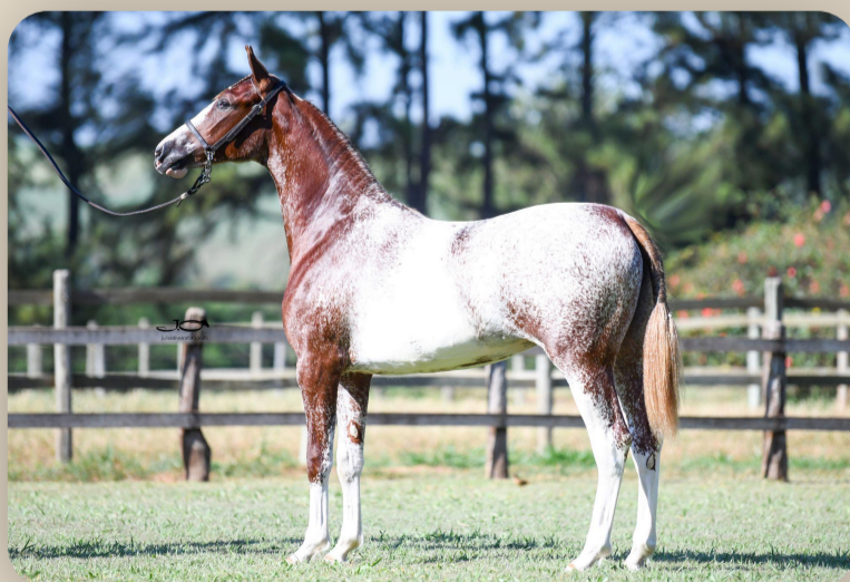
Falua da Piratininga Irmã materna