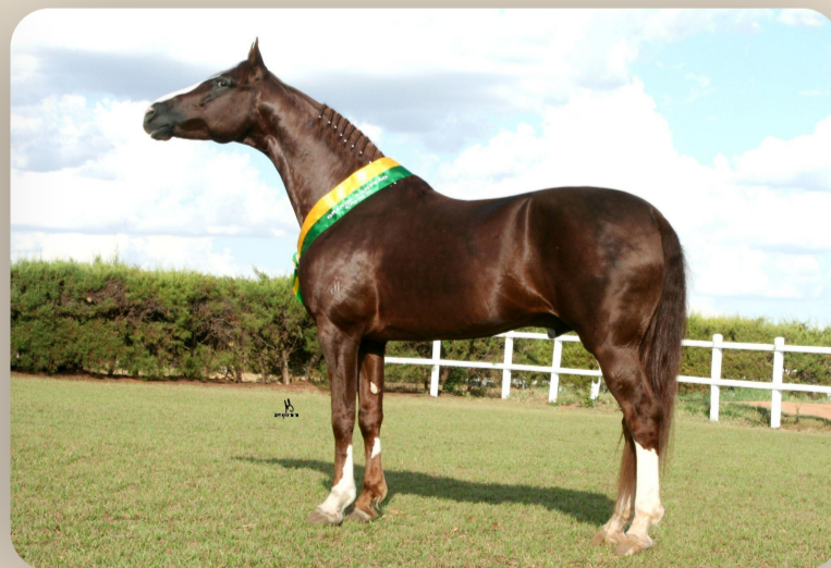
Turim da Araxá Irmão materno