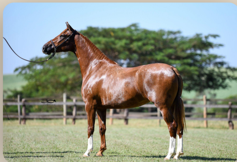
Ópera da Araxá