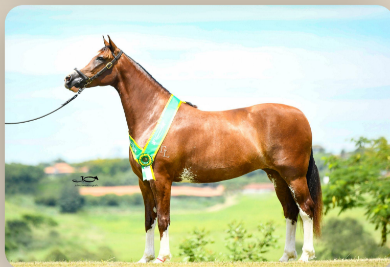
Evidência da Tarlim Irmã materna