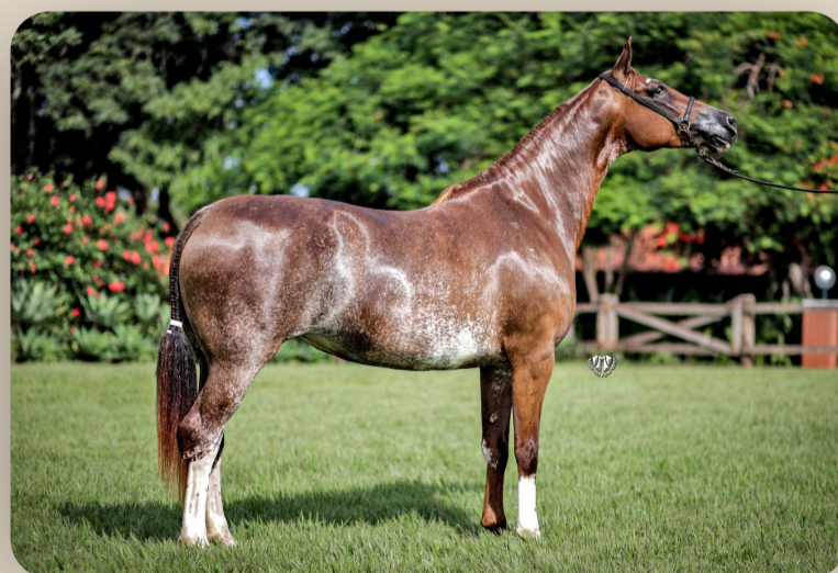
Intuição da Araxá