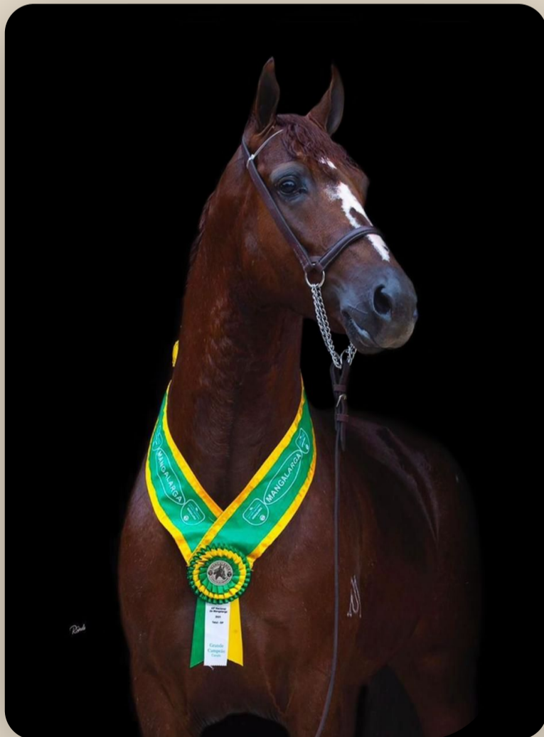
Instinto da Araxá Irmão materno