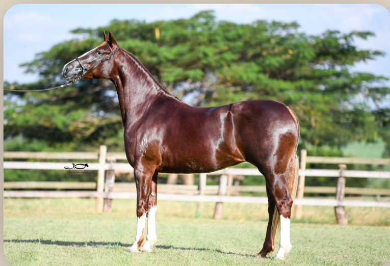
Natureza da Araxá Irmã própria