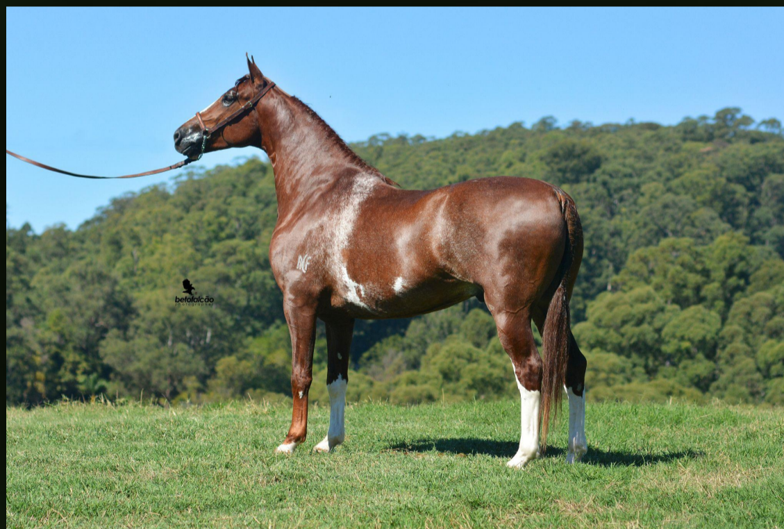
Justiceiro ACF (T.E.) · Padreador