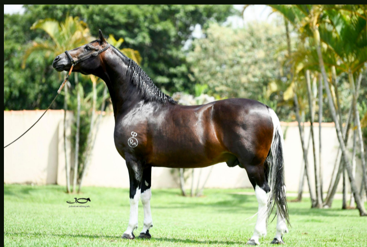
Puma R.M. (T.E.)