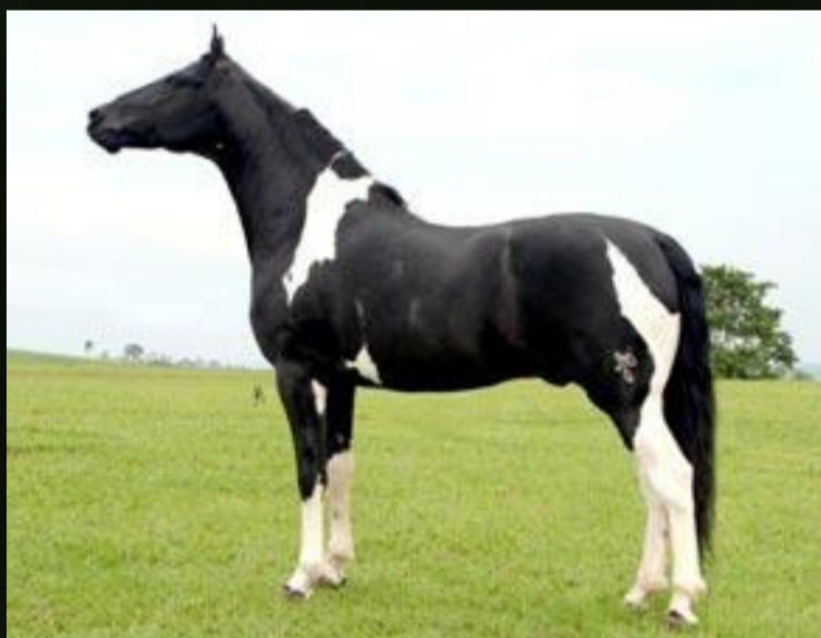
Jrael do Jaó · Pai

O comprador passará a ser sócio do Hara RM, intercalando, a cada 12 (doze) meses, os direitos de alojamento e estadia. Os sócios também irão alternar os direitos reprodutivos da égua, incluindo prenhez de T.E., embriões congelados e demais produtos reprodutivos.