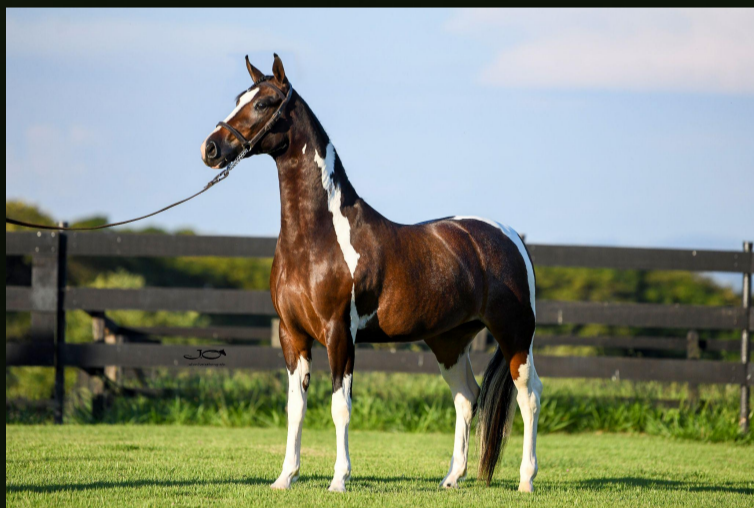
Harmonia Dara (T.E.)

100% de um embrião com garantia de fêmea para escolher entre os seguintes reprodutores: PUMA RM, MESSI DO GADU, ELEGANTE JEB ou ENCANTO DA JAUAPERI. Escolha na batida do martelo.