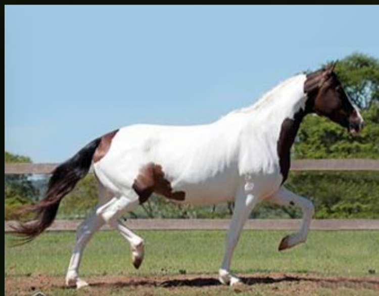
Matinada R.M. · Mãe