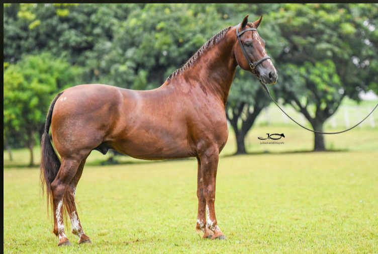
(T.N.) Alecrim MAB