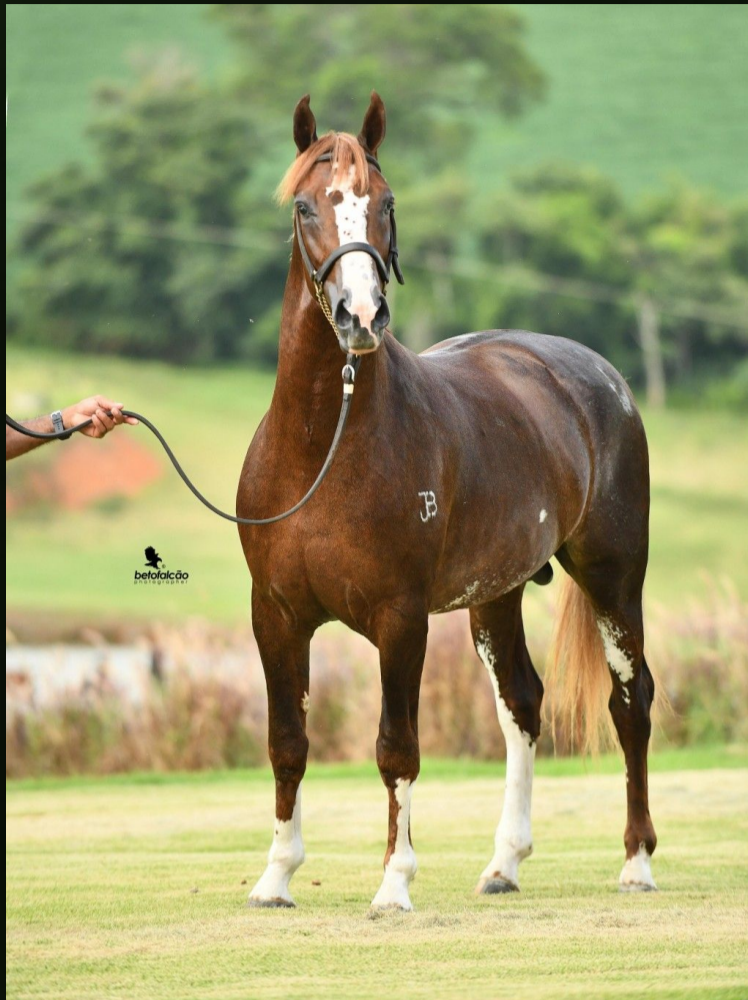
Elegante J.E.B. (T.E.)