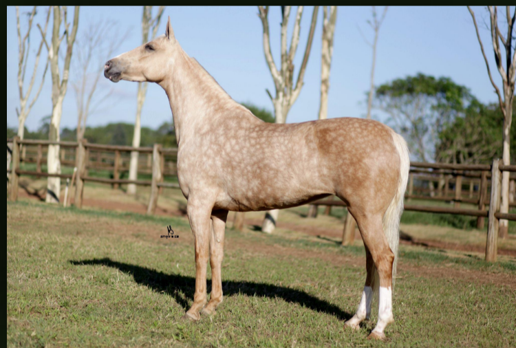
Bambina Mangabaia (T.E.) · Mãe