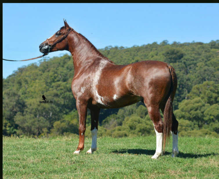
Justiceiro ACF (T.E.) · Padreador