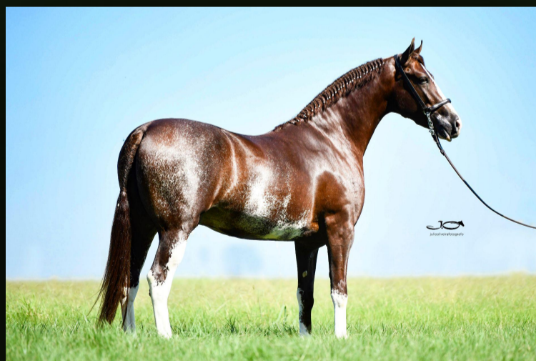
Messi do Gadu (T.E.)