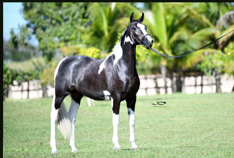
Kamala da Braido (T.E.)