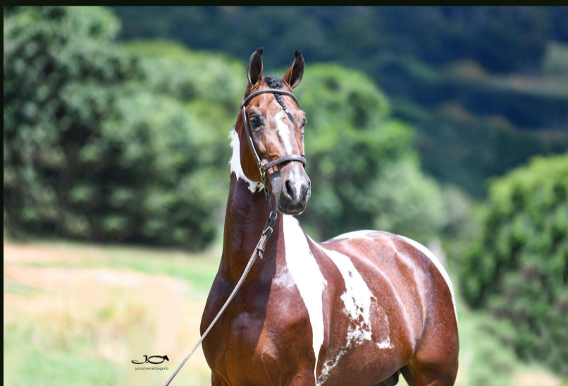
Imperial Donat (T.E.) · Padreador