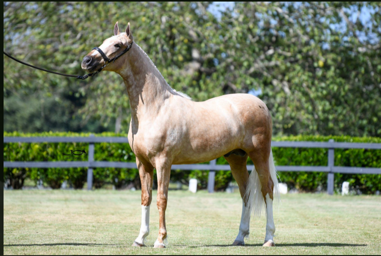
Xerox do H.I.C. (T.E.)