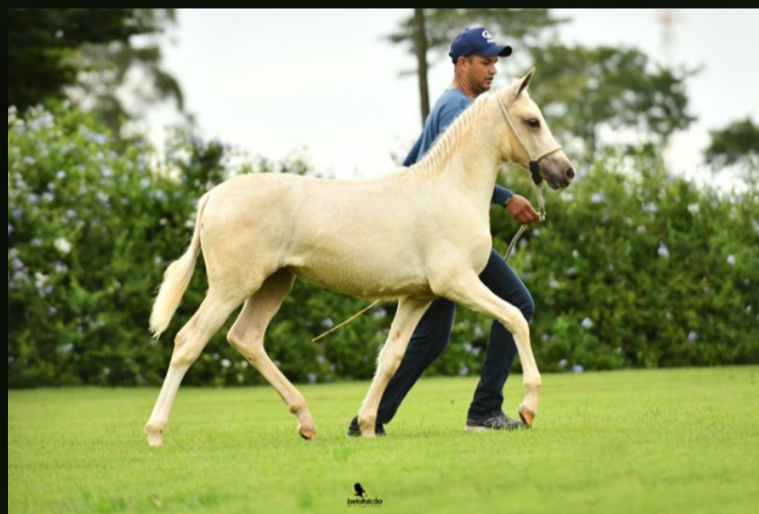
Q-Doçura do Gadu · Filha