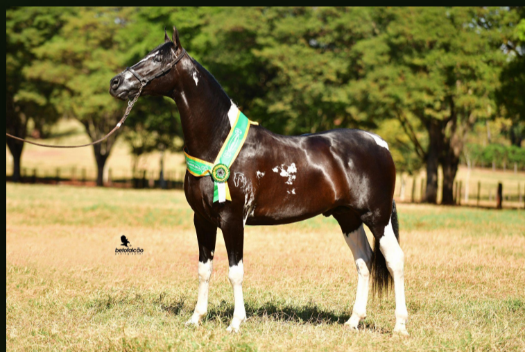
Fator do Fabuloso (T.E.) · Pai

Grande promessa para disputar as pistas e se tornar uma doadora de embriões.