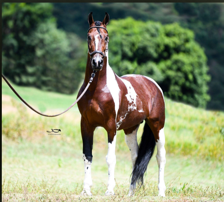
Imperial Donat (T.E.)