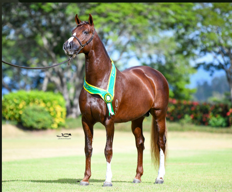
Encanto da Jauaperi (T.E.)