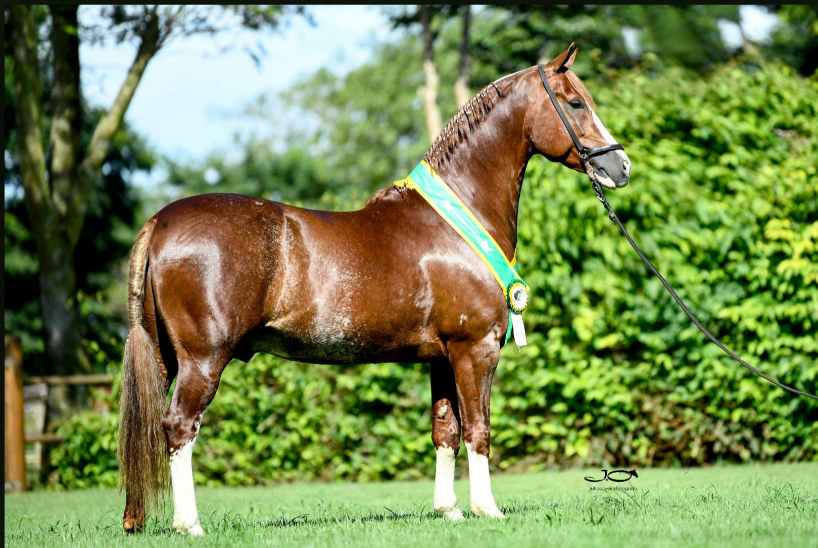
Diamante do Gadu (T.E.) · Padreador

O comprador passará a ser sócio da Mangalarga PLGG e Haras FAT.