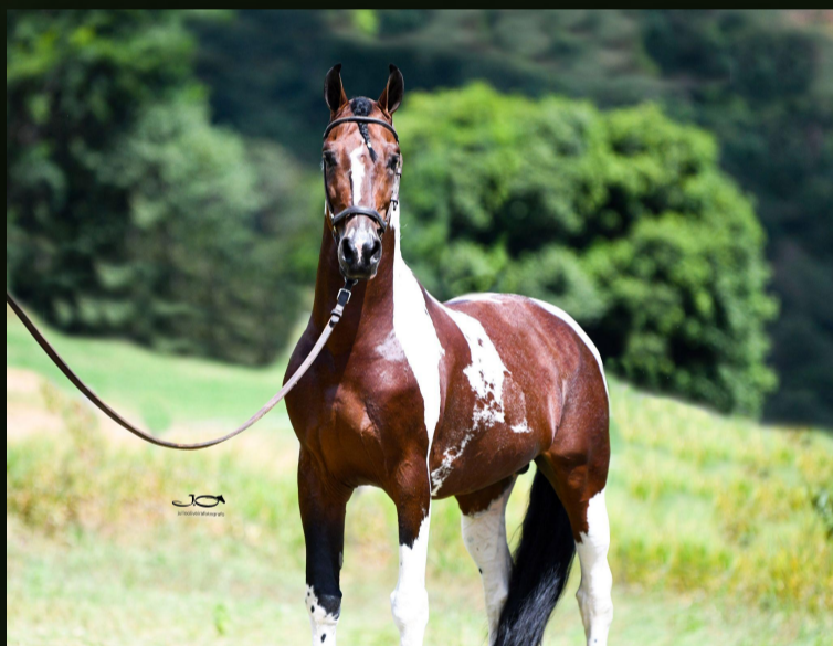
Imperial Donat (T.E.) · Pai

Promessa para disputar as pistas e se tornar uma grande doadora de embriões.