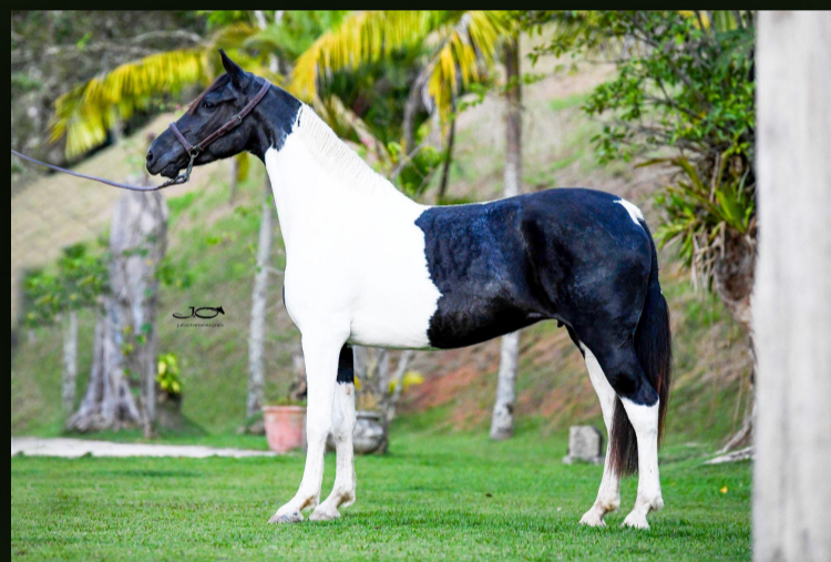
Xavantina R.M. · Mãe