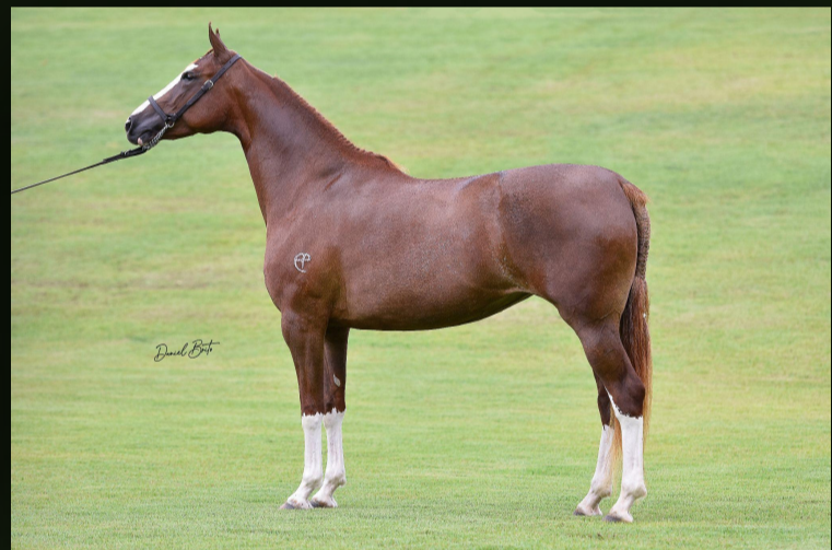
Avalanche OTN (T.E.) · Mãe