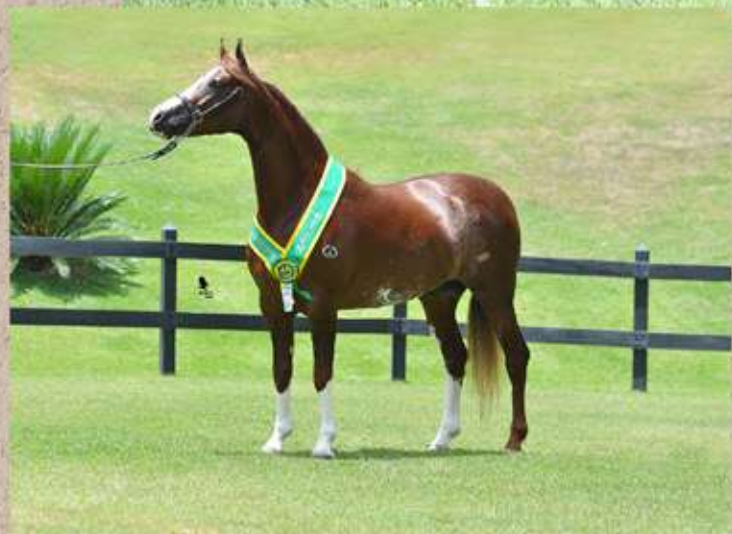
DIAMANTE DO GADU