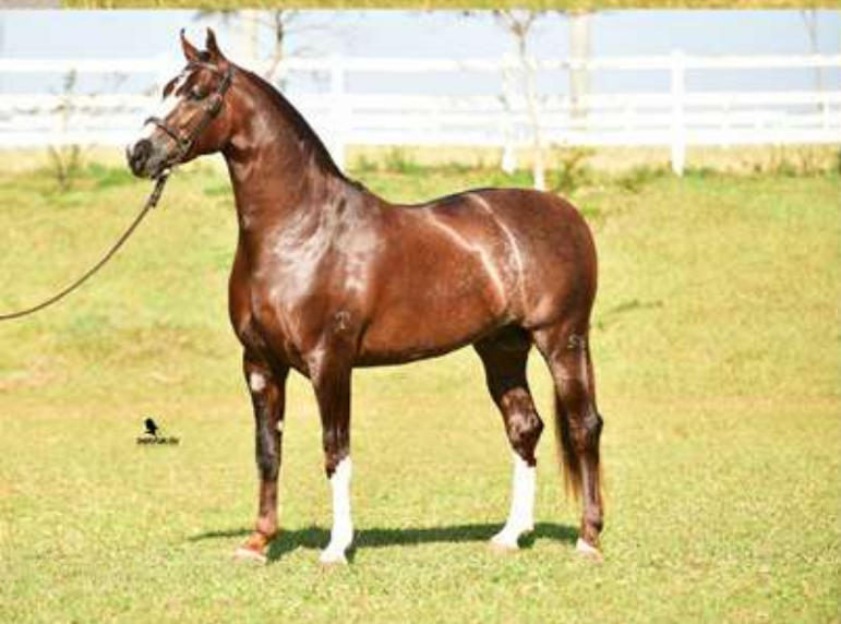
HAMAL DO ESPINHAÇO