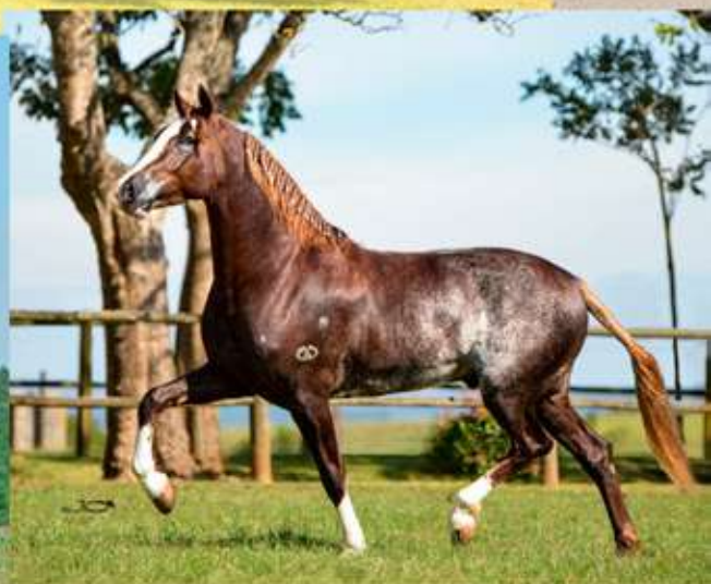
ELEGANTE DO GADU